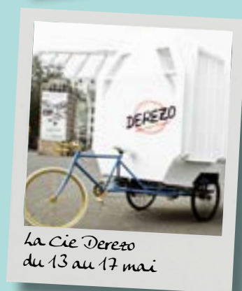
La Cie Derezo du 13 au 17 mai