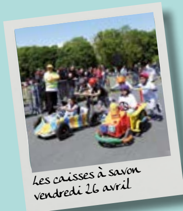
Les caisses à savon vendredi 26 avril