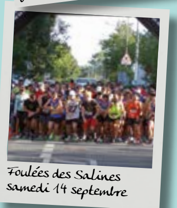
Foulées des Salines samedi 14 septembre

Toutes les infos sur : www.collectif-villeneuve.com www.facebook.com/tele.villeneuve