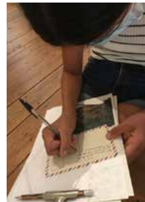
Atelier Jeu d'roles

Visite guidée de l'exposition Les Fils de Sanna. Inuit de l'Arctique .